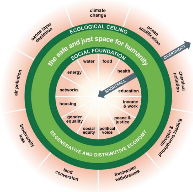
図 1. Kate Raworth によって提案されたドーナツ経済